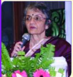
ट्रस्टनु अहवाब वांगडा श्रीमती लीवुबेन विनोद भागाश्री