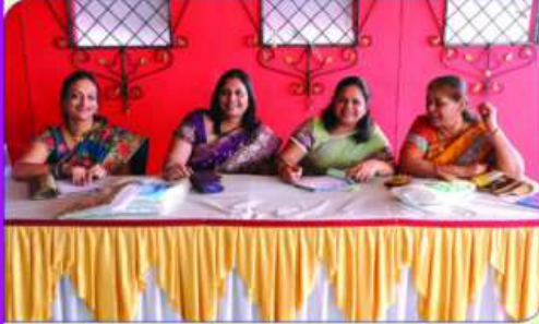
सांयरा सदियर द्वारा रञ्जस्ट्रेशन