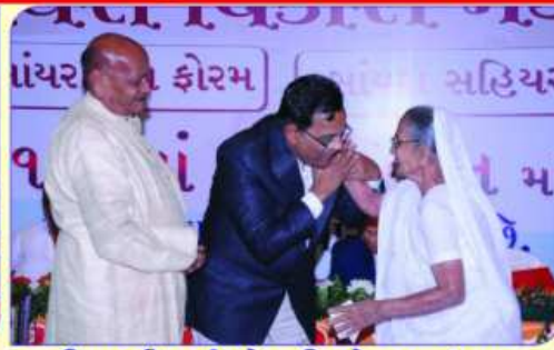
मातुश्री माणीबाई जेतशी मोमायानु अहुमानुश्री माणीबाई जेतशी मोमाया परिवार