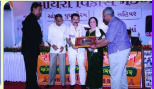
मातुश्री लयीबाई पदमशी वोडाया परिवार श्री शांतिवाल वोडायांनु उद्बोधन सांयरा स्न" श्रीमती गायामेन अने श्री लस्त दनानींनु सन्म