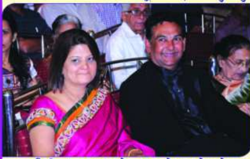
संस्थेतानी स्मित मुद्रामां सौ. राजकुलबेन अने लदेशभाई-स, भरती अने म्युजिकमां तरबोव सांयरा सेनेट