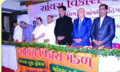
शानदार मंत्र उपर महानुभावो