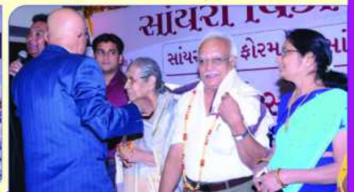
मा. दमयंतीने स्तनशी बोडया परिवारनु अहुमानु