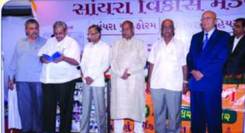
वीवाधर नरशी मोमाया अनिधीगुड महाजनश्रीने अर्पण विधि