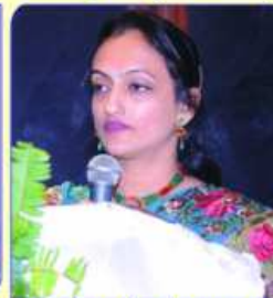
सांयरा सहियरुओ अहवाब आपता