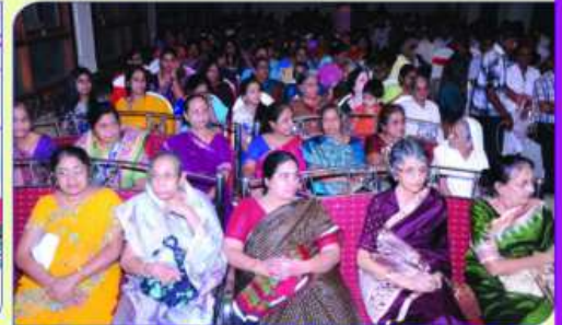
स्नेहमिलनमां उपस्थित ज्ञातिज्मो अने मडेमा