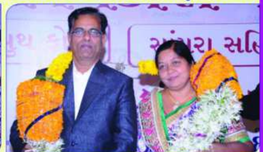
सांयरा स्न" जिताभ स्विकस्ता ज्यामेन अने शांतिबेन वोडाया ज्यामेन अने श्री शांतिवाल वोडायांनु कुवडरवी अभिवास्तंयरा स्न" श्रीमती ज्यामेन अने शांतिवाल वोडाया