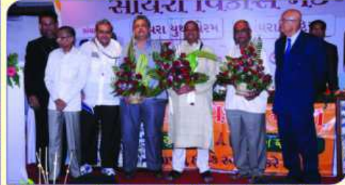
सर्वश्री दामळभाई, विजयभाई, गीरीशभाई अने राजेन्द्रभाईनु अहुमानु कस्ता महाजनना अजागीआ