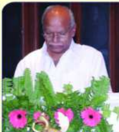
सांयरा देवासरनी वज्जानो यडावो ओवता वावळभाई भाणा अने श्री उत्तमभाई भागायाश्रीमती वेशावी विजय वरमशी